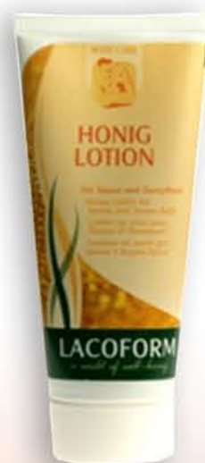
Krem miodowy, 100 ml

Dobroczynne składniki, moc witamin i mikroelementów sprawia, że skóra staje się piękna, gładka, elastyczna, sprężysta i jedwabiście miękka. Połączenie działania temperatury i pielęgnacyjnego wpływu miodu spowoduje, że zabieg stanie się niezwykle przygodą dla ciała i ducha. Moc witamin z grupy B, witaminy P, C, biotyny oraz mikroelementów takich jak: wapń potas, magnez, żelazo sprawiają, że skóra stanie się miękka, odpowiednio nawilżona, elastyczna, gładka i jędrna. Specjalna formuła, odpowiednia konsystencja sprawi, że po każdym jego użyciu pozostanie uczucie miękkości i świeżości, a zabieg będzie obfitować w niezapomniane chwile relaksu i przyjemności.